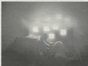
Erinnert an ein türkisches Bad: Die Sauna (o). Die Form des Pools wurde beibehalten, ebenso das Mosaik. Mit den Fenstern und der schlichten Bauhaus-Optik wurde jedoch ein völlig neuer Effekt geschaffen.